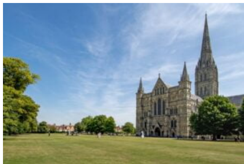
Southampton - Salisbury

Pelo mesmo preço e também entre os dias 12 de maio a 15 de outubro , o MSC Virtuosa fará outro itinerário nas mesmas datas que partirá de Southampton (Inglaterra) , navegará para La Rochelle (França), Bilbao, La Coruña (Espanha), Cherbourg (França) e desembarcará em Southampton .