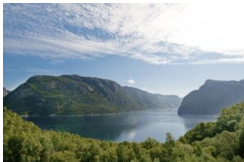
Stavanger - Dirdal Valley

dois itinerários. Com partida e chegada a Hamburgo a 19 de junho de 2023 , o MSC Preziosa percorrerá a Noruega, passando por Molde, Fjord, Tromso, Longyearbyen, Honningsvag, Bergen, Kristiansand (Noruega), e Skagen (Dinamarca) durante 15 noites . Ao longo de 14 noites , com embarque e desembarque em Hamburgo a 6 de agosto, o navio passará por Molde Fjord, Tromso, Longyerabyen, Honningsvag, Olden e Stavanger (Noruega) . Os dois itinerários começam nos 1199€ cruzeiro + 250€ de taxas portuárias + 168€ TSH . Com a promoção das bebidas incluídas , os preços partem dos 1479€ cruzeiro + 250€ taxas portuárias + 168€ TSH .