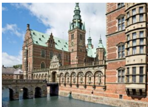
Copenhaga - Hillerød, Frederiksborg Castle

Bálticos , sem nunca esquecer as extraordinárias capitais escandinavas como Oslo, Estocolmo, Helsínquia e Copenhaga , poderá percorrer todos estes destinos nos cruzeiros pelo Norte da Europa . Não perca esta oportunidade!