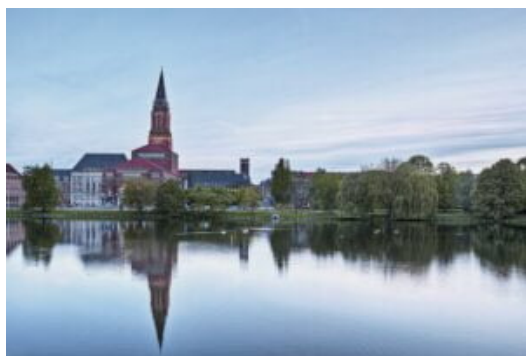
Kiel - Kieler Rathaus

O MSC Poesia fará um itinerário de 21 noites , percorrendo um itinerário que passará pela Gronelândia . O navio passará por Copenhaga, Warnemunde, Reiquejavique (Islândia), Prince Christian Sund, Ilulissat, Nuuk, Qaqortoq (Gronelândia), Akureyri (Islândia) Lerwick (Escócia) e desembarque em Copenhaga . Os preços começam nos 2559€ cruzeiro + 250 € taxas portuárias + 252€ TSH . Com a promoção das bebidas incluídas , os preços iniciam-se nos 2979€ cruzeiro + 250€ taxas portuárias +252€ TSH . Haverá ainda um itinerário alternativo que parte de Copenhaga e passa por Warnemunde, Kirkwall, Stonorway (Escócia), Reiquejavique (Islândia), Nuuk, Iliçossat, Qaqortog (Gronelândia), Isafjordur, Akureyri (Islândia) e desembarque em Copenhaga pelos mesmos preços e duração .